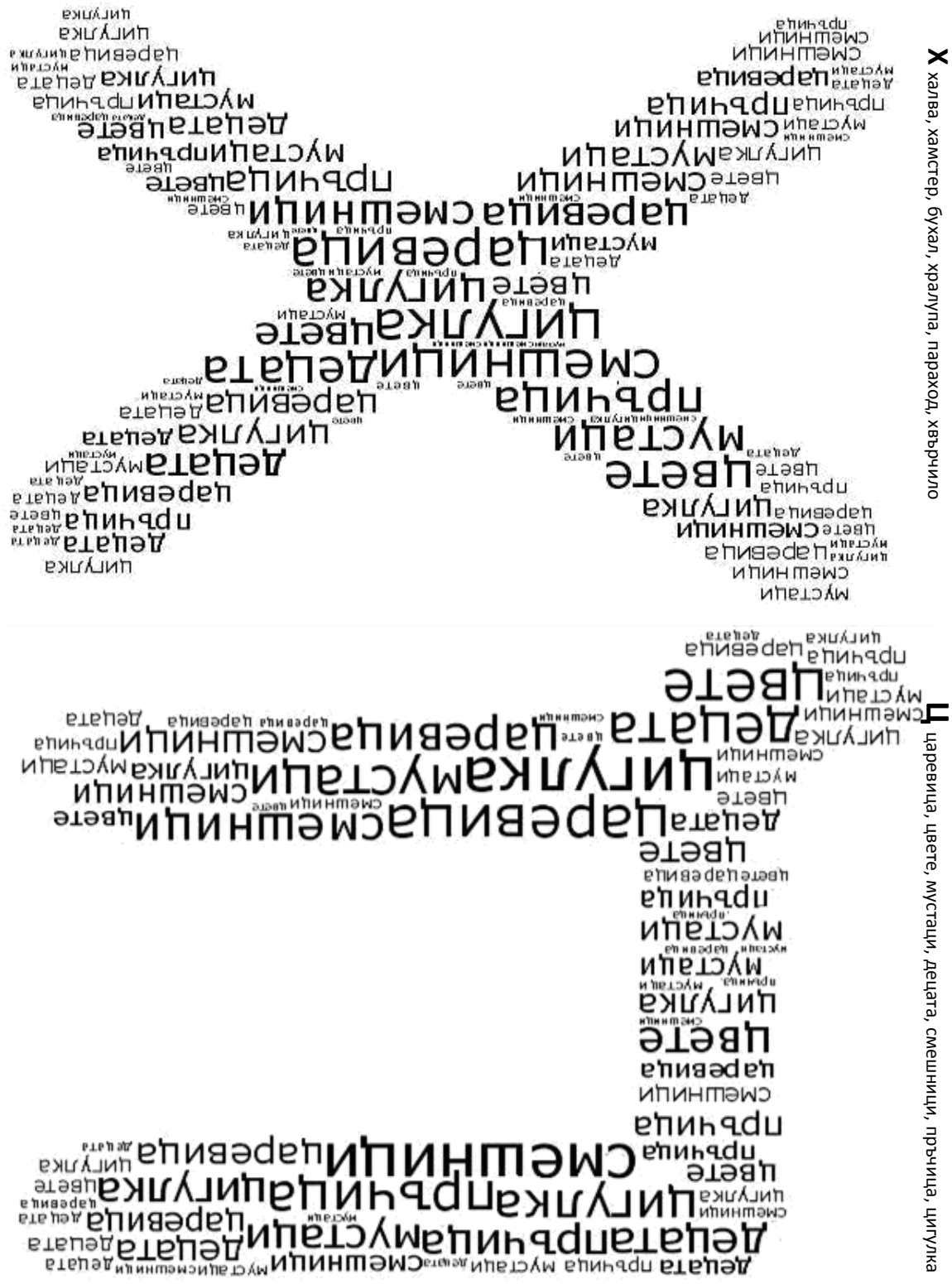
У паревница, цвете, мустаци, децата, смешници, пръчица, пилулка