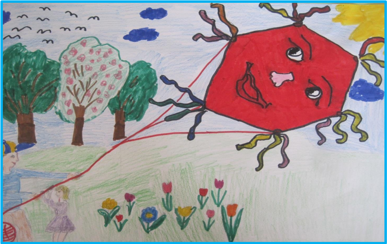
„С татко пускаме хвърчило“