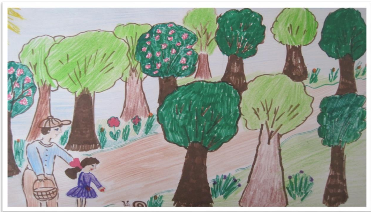
„На разходка в гората“